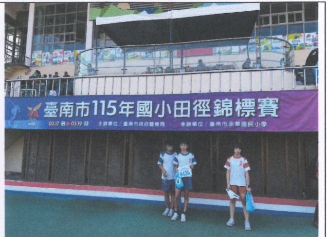
參加歷年市長盃田徑錦標賽獲得佳績—樂動