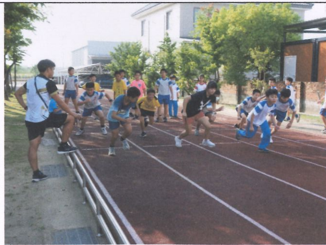
提昇學生運動量達成率--多元體育社團 活動—田徑