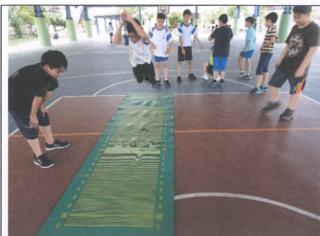
定期辦理體適能測驗