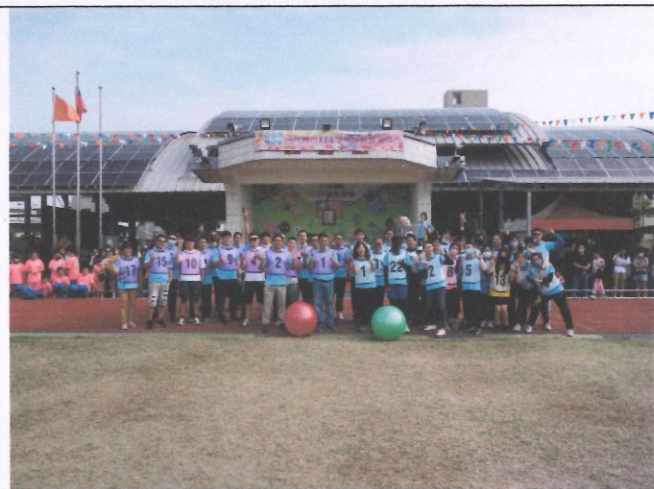
辦理校慶運動會，提昇學童 正向心理健康體位。