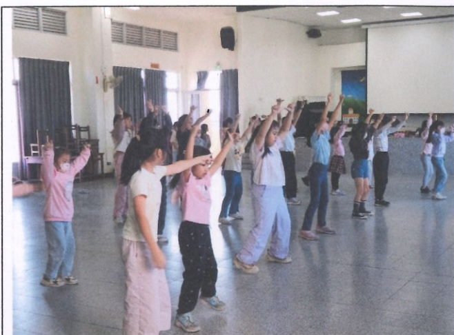
提昇學生運動量達成率— 多元體育社團活動—舞蹈