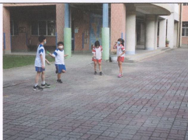
下課多元活動-跳繩