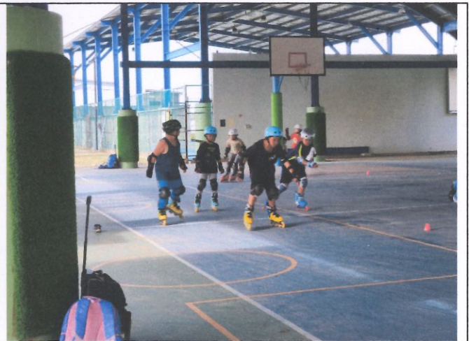
提昇學生運動量達成率--多元體育社團 活動—直排輪