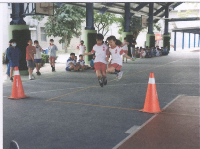
提昇學生運動量達成率— 多元體育社團活動—跳繩