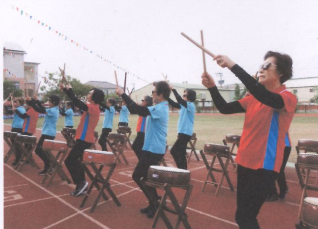
推廣社區運動量—樂齡成員—太鼓