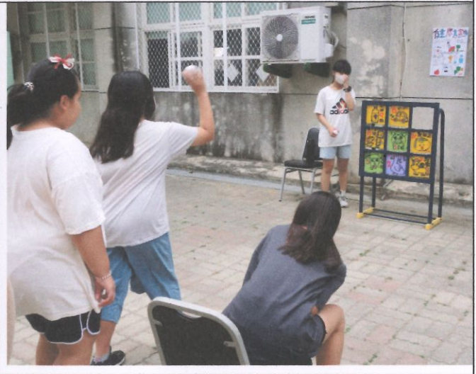
辦理兒童節闖關活動—樂動。