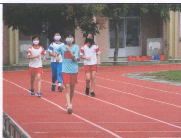
進行下課大跑步計畫—樂動