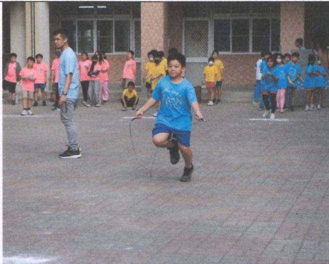
每年辦理校內班級跳繩接力比賽—樂動。