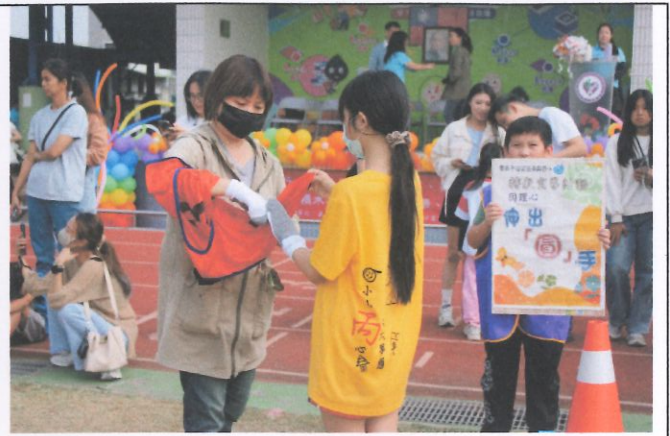
辦理親子運動會，將相關宣導觀念帶給家長及社區